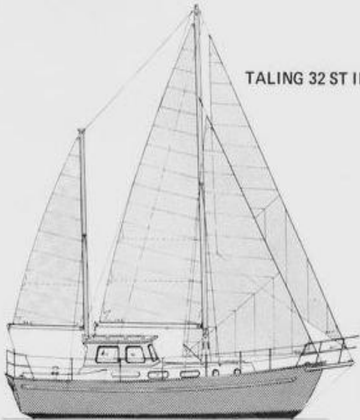
TALING 32 ST II